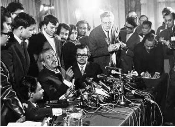
১৯৭২ সালের ৮ই জানুয়ারি পাকিস্তানের কারাগার থেকে মুক্ত হয়ে লন্ডনে ক্ল্যারিজেস হোটেলের প্রেস কনফারেন্সে বিশ্ব মিডিয়ার মুখোমুখি বঙ্গবন্ধু শেখ মুজিবুর রহমান