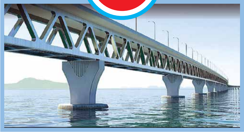
পদ্মা বহুমুখী সেতু

গণপ্রজাতন্ত্রী বাংলাদেশ সরকারের মাননীয় প্রধানমন্ত্রী বঙ্গবন্ধু কন্যা শেখ হাসিনা ২৫ জুন ২০২২ তারিখে গৌরব ও সক্ষমতার প্রতীক দেশের বৃহত্তম সেতু পদ্মা সেতুর শুভ উদ্বোধন করেন। কোনোরূপ বৈদেশিক সাহায্য ছাড়াই মাননীয় প্রধানমন্ত্রী শেখ হাসিনার ব্যক্তিগত তত্ত্বাবধানে বাংলাদেশের নিজস্ব অর্থায়নে বাস্তবায়িত সর্ববৃহৎ প্রকল্প এই স্বপ্নের পদ্মা সেতু। মূল সেতুর দৈর্ঘ্য ৬.১৫ কি.মি। মুন্সিগঞ্জ জেলার মাওয়া থেকে শরীয়তপুর জেলার জাজিরা পর্যন্ত সংযুক্ত এই সেতুটি দুই স্তর বিশিষ্ট। এর উপরের স্তরে রয়েছে চার লেনের সড়ক পথ এবং নিচের স্তরে একটি রেলপথ। ৩০ হাজার কোটি টাকারও অধিক ব্যয়ে তৈরি এই সেতুটি বাংলাদেশের দক্ষিণাঞ্চলের সামাজিক, অর্থনৈতিক ও শিল্প বিকাশে উল্লেখযোগ্য অবদান রাখার পাশাপাশি এর উপকারভোগী হবে সারাদেশের মানুষ।