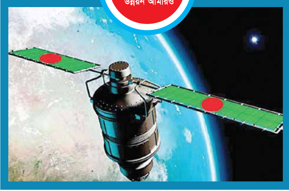
বঙ্গবন্ধু স্যাটেলাইট-১ : বাংলাদেশের মালিকানাধীন প্রথম কৃত্রিম উপগ্রহ

বঙ্গবন্ধু স্যাটেলাইট-১ বাংলাদেশের প্রথম ভূস্থির (Geostationary) যোগাযোগ ও সম্প্রচার উপগ্রহ। এর মধ্যে দিয়ে ৫৭ তম দেশ হিসেবে নিজস্ব স্যাটেলাইট উৎক্ষেপণকারী দেশের তালিকায় যুক্ত হয় বাংলাদেশ। এটি ১১ই মে ২০১৮ যুক্তরাষ্ট্রের কেনেডি স্পেস সেন্টার থেকে উৎক্ষেপণ করা হয়। এটি ছিল ফ্যালকন ৯ ব্লক-৫ রকেটের প্রথম পেলোড উৎক্ষেপণ। এটি ফ্রান্সের থেলিস অ্যালেনিয়া স্পেস কর্তৃক নকশা ও তৈরি করা হয়েছে। বঙ্গবন্ধু স্যাটেলাইট-১, ১৬০০ মেগাহার্টজ ক্ষমতাসম্পন্ন মোট ৪০টি কে-ইউ এবং সি-ব্যান্ড ট্রান্সপন্ডার বহন করছে এবং এর আয়ু ১৫ বছর। এর নির্মাণ ব্যয় প্রায় তিন হাজার কোটি টাকা। বর্তমানে স্যাটেলাইটের ব্যান্ডউইথ ও ফ্রিকোয়েন্সি ব্যবহার করে ইন্টারনেট বন্ধিত অঞ্চল যেমন- পার্বত্য ও হাওড় এলাকায় ইন্টারনেট সুবিধা প্রদান করা সম্ভব হচ্ছে, প্রত্যন্ত অঞ্চলে ইন্টারনেট ও ব্যাংকিং সেবা, টেলিমেডিসিন ও দূরশিক্ষণ ব্যবস্থা প্রসারেও এটি ব্যবহৃত হচ্ছে। টিভি চ্যানেলগুলো তাদের সম্প্রচার সঠিকভাবে পরিচালনার জন্য বিদেশি নির্ভরতা কমিয়ে এর উপর নির্ভর করছে। ফলে দেশের টাকা দেশেই থাকছে। বড় প্রাকৃতিক দুর্যোগের সময় মোবাইল নেটওয়ার্ক অচল হয়ে পড়লে এর মাধ্যমে দুর্গত এলাকায় যোগাযোগ চালু রাখা সম্ভব। শুধু তাই নয় শেখ হাসিনা সরকারের বর্তমান মেয়াদেই বঙ্গবন্ধু স্যাটেলাইট-২ মহাকাশে উৎক্ষেপণেরও উদ্যোগ নেওয়া হবে। বঙ্গবন্ধু ১৯৭৫ সালের ১৪ই জুন বেতবুনিয়ায় ভূ-উপগ্রহ কেন্দ্র স্থাপনের মাধ্যমে যে স্বপ্নের বীজ বপন করেছিলেন, সেই স্বপ্ন মহীরুহে পরিণত করেছেন প্রধানমন্ত্রী শেখ হাসিনা।