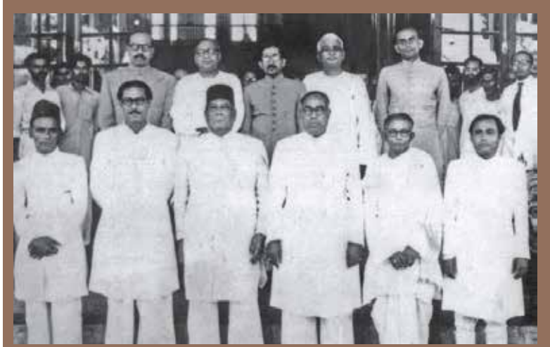
যুক্তফ্রন্ট সরকারের মন্ত্রীপরিষদ সদস্যদের সাথে ১৯৫৪ এর নির্বাচন পরবর্তী সময়ে বঙ্গবন্ধু শেখ মুজিবুর রহমান

পূর্ব বাংলার প্রাদেশিক পরিষদের নির্বাচনে মুসলিম লীগের শোচনীয় পরাজয় ঘটানোর লক্ষ্যে ১৯৫৩ সালের ১৪ই নভেম্বর আওয়ামী মুসলিম লীগ যুক্তফ্রন্ট গঠনের সিদ্ধান্ত গ্রহণ করে। যুক্তফ্রন্ট মূলত চারটি দল নিয়ে গঠিত হয়েছিল।