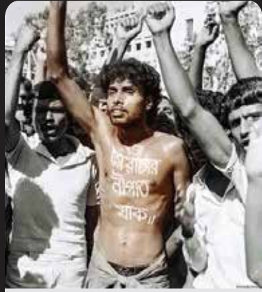
শহিদ নূর হোসেন